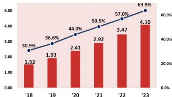
図表 7-13：中国のBtoC-EC市場規模とEC化率の拡大予測（単位：兆USドル）

近年、中国EC市場は著しく成長し、2020年予測では市場規模2.41兆USドル（約256兆円）に達するとも予測されています（※1）。そして、ここ数年でその成長に欠かせない存在になりつつあるのがライブコマース（ライブ配信による商品販売）です。2019年は約6兆5,000億円だった市場規模が、2020年には約14兆4,150億円と、1年で約2.2倍に拡大すると予測されています（※2）。