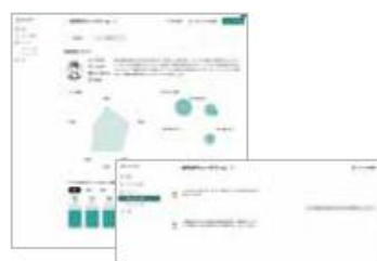
ペルソナ作成・対話

更にアイスタイルでは、AI によるクチコミ分析によって見えた「気づき」や「仮説」を、@cosme が、コスメ・美容の総合サイト「@cosme」、EC「@cosme SHOPPING」、実店舗「@cosme STORE」を運営する中で蓄積してきた、カスタマージャーニーを一気通貫した膨大なデータを統合した統合データ基盤（CDP）をフル活用して更に深く分析して、実際のマーケティング戦略や CRM 施策、商品開発へと昇華するとともに、戦略の実行や検証までワンストップで伴走する「データコンサルティングサービス」も更に強化します。