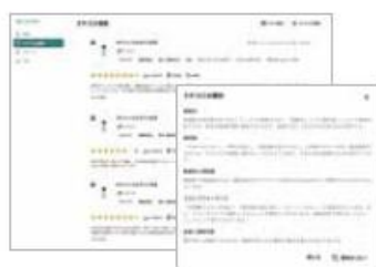
クチコミ検索・要約