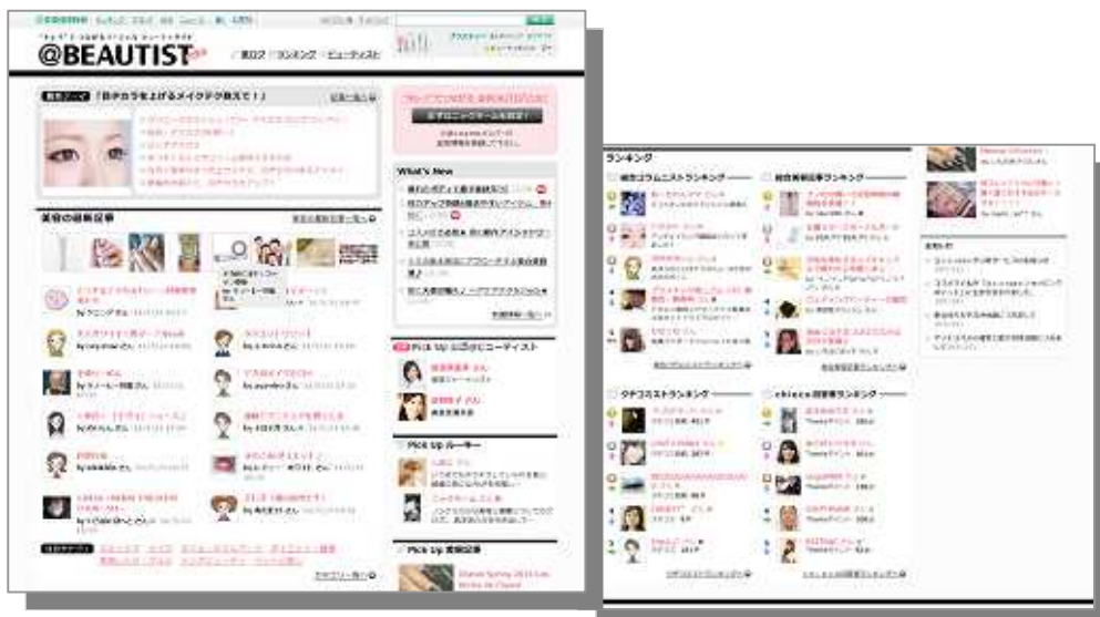
【@BEAUTIST トップページ(7月予定イメージ)】

化粧品だけでなく、ヘアスタイル・アロマ・ダイエット、待望のメンズビューティーなど、今までのアットコスメにはない美容全般を網羅したカテゴリを用意。老若男女問わず、美容に関心のある人がコミュニケーションを行うことで、サイト内外での繋がりが無限に広がるSNSが登場しました。