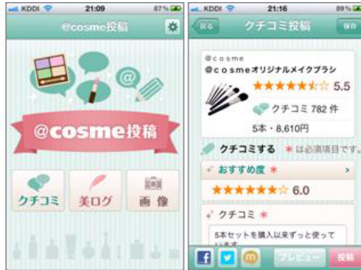
【@cosme投稿】スマートフォン対応アプリ画面イメージ】