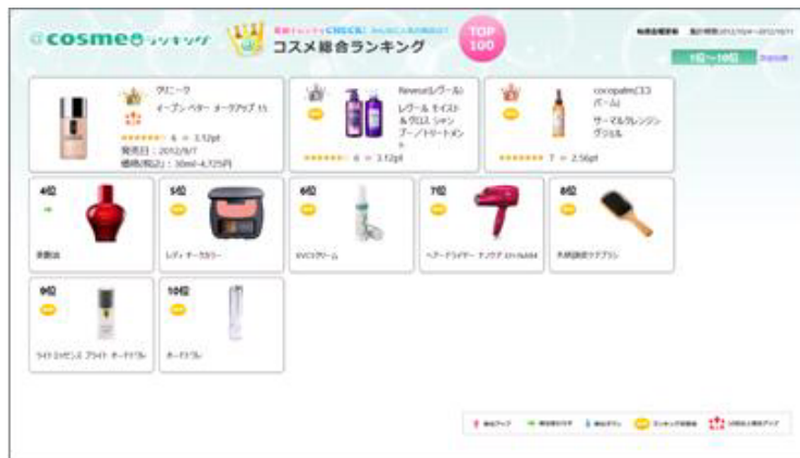
【@cosme】Windows8対応アプリ画面イメージ】

アイスタイルでは今後もユーザーの変化に即したサービス開発を積極的に行い、会員向けサービスを含めた新しいコミュニケーションプラットフォームの構築を促進してまいります。