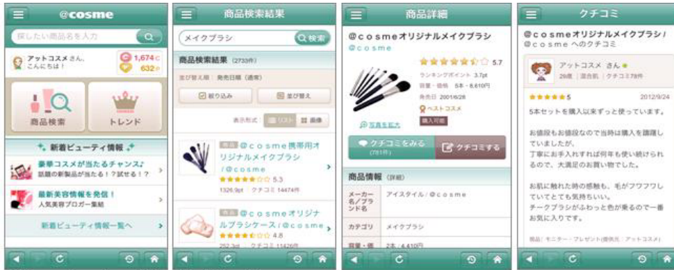
【@cosme】スマートフォン対応アプリ画面イメージ】